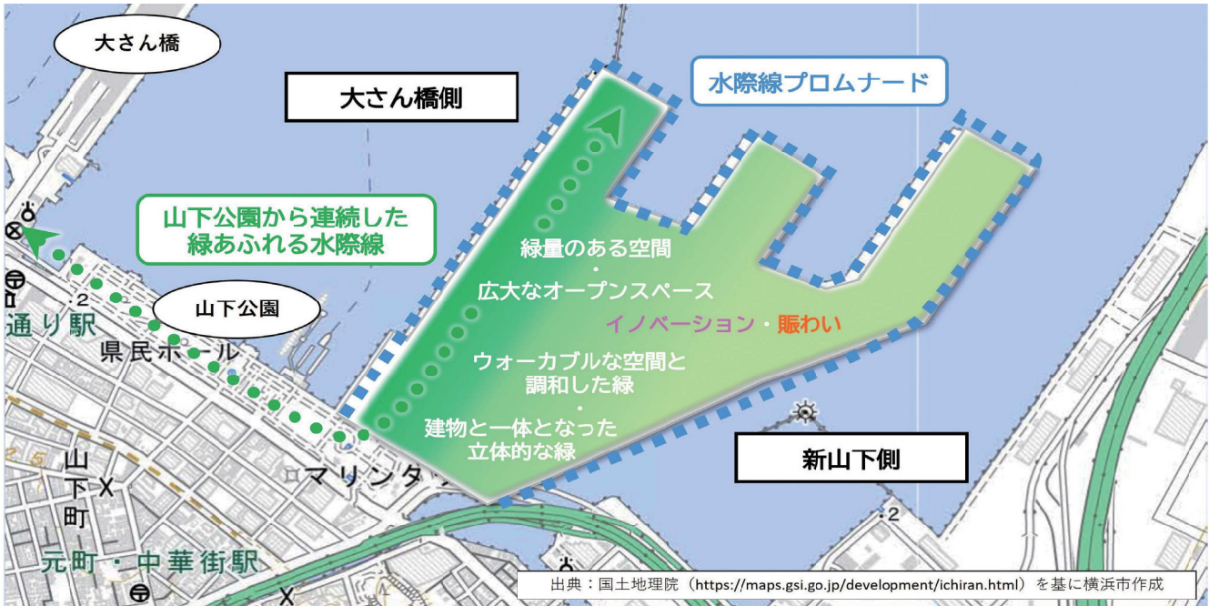
画像：山下ふ頭再開発 事業計画案より

出典：国土地理院 ( https://maps.gsi.go.jp/development/ichiran.html ) を基に横浜市作成