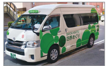
四季めぐり号(旭区) 地域公共交通例 市資料

とまだまだ少ない目標です。引き続き、地域のみなさんの要望を集めながら、移動しやすい街を目指して議会で更なる推進を求めています。