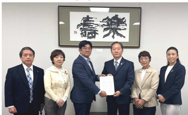
アンケート結果を手渡す党市議団