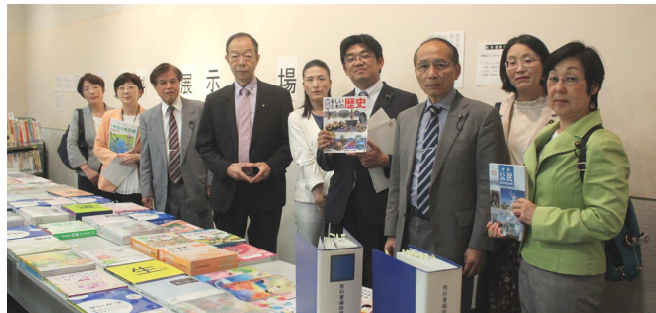
6/4 市中央図書館で閲覧する 日本共産党横浜市議団(9人)

教科書展示会に行き、アンケート用紙に意見、感想を書きましょう。又は、直接、市教育委員会にFAXしましょう。045-663-5547（総務課）